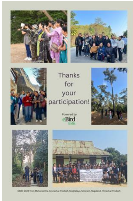
Team RKMV in Bird Count India Poster