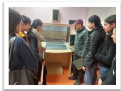
एफएम एवं प्लेबैक स्टूडियो