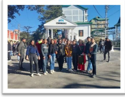
विधानसभा परिसर शिमला